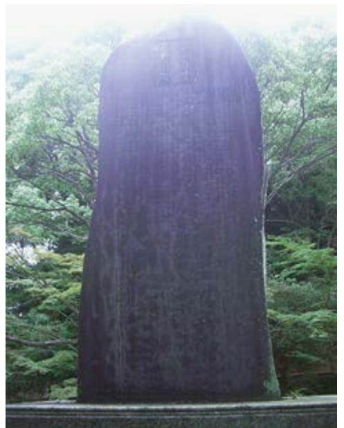
晋作顕彰碑 下関市