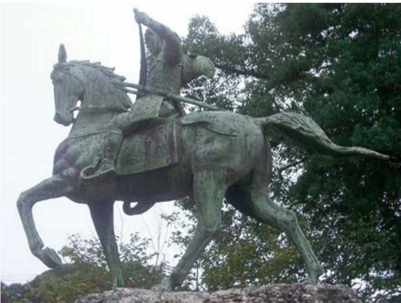
功山寺の晋作像 下関市