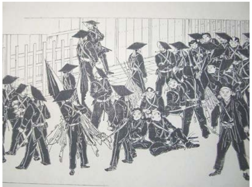
『戊辰戦記絵巻』に描かれた奇兵隊 著者蔵